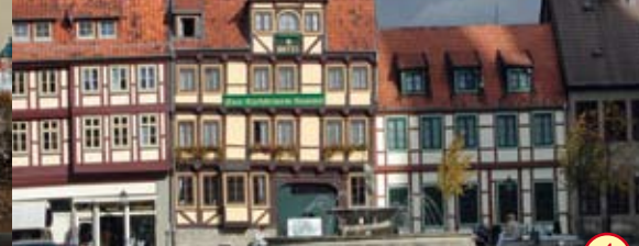
Hotel „Zum Brauhaus“ Lüdde