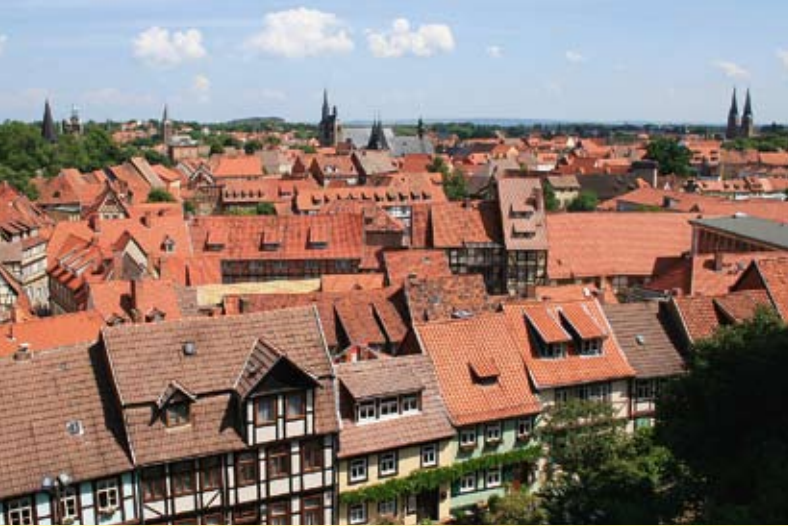
Blick auf die historische Altstadt

Fachwerksanierung, sind hier in hoher Spezialisierung beheimatet. So knüpft ein Quedlinburger Glaskunstbetrieb an die Jahrhunderte alte Tradition an und ist auch international tätig. Unternehmen der Metall- und Kunststofftechnik und -verarbeitung sind am Markt etabliert. Die Qualitäten des Wohntandortes Quedlinburg liegen nicht nur in der landschaftlich ausgesprochen reizvollen Lage im nördlichen Harzvorland begründet sondern auch in der klimatischen Besonderheit des Regenschattens des Harzes. Dieses Phänomen beschert unserer Stadt und ihrer unmittelbaren Umgebung überdurchschnittlich viele Sonnenstunden und deutlich weniger Regen als den Nachbarorten. Individuelles Wohnen gepaart mit urbanem Leben spricht ein breites Spektrum unterschiedlicher Bedürfnislagen an. Rund 14.000 Wohneinheiten bieten Wohnen im Fachwerk, in Jugendstilvillen, in so genannten industriellen Wohnungsbauten sowie modernes Wohnen in der historischen Altstadt oder im Einfamilienhaus an der Peripherie. Quedlinburg zeichnet sich durch kurze Wege aus und ist somit besonders attraktiv für Familien und Senioren. In der historischen Innenstadt bieten Einzelhandel und Kaufleute ein attraktives Angebot, fernab von „Deichmannisierung“ und Uniformität. Individuelle Angebote in Boutiquen und Fachgeschäften laden zu einem