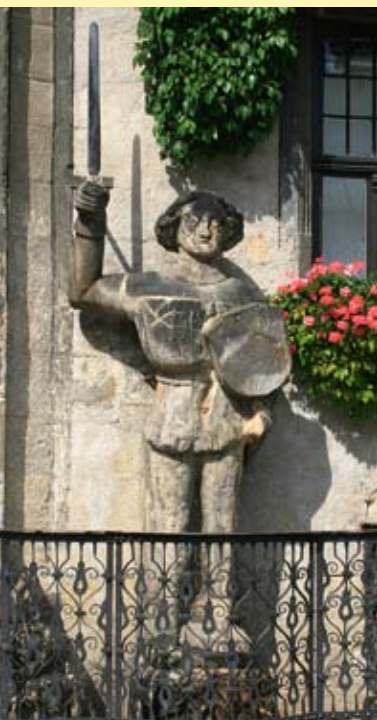
Roland am Rathaus

ist Erinnerungstätte für den bedeutendsten deutschen Odendichter. Weiterhin sind dort Exponate der I. deutschen promovierten Ärztin Dorothea C. Erxleben und des Geographen Carl Ritter zu finden. Die Lyonel-Feininger-Galerie präsentiert die Werke des postmodernen Künstlers. Die Werke setzt sie gleichzeitig mit dem geistigen und kunsthistorischen Umfeld in Beziehung. Aufführungen des Nordharzer Städtebundtheaters, des Quedlinburger Musiksommers, in der Stiftskirche, im Salfeldtschen Palais und in der Blasiikirche sind