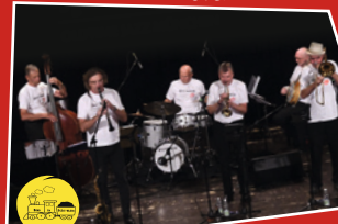
Hot Lips // München