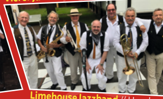
Limehouse Jazzband // Hamburg