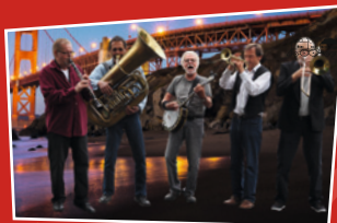
Frisco Five // Hannover

Facettenreich, improvisiert, gefühlvoll, spontan, elektrisierend, emotional - eben Musik aus Leidenschaft!