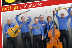
Farmhouse Jazz & Blues Band // Groningen (NL)