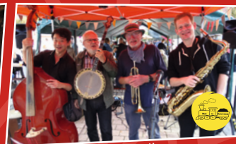
Vierer Jatz Bande // Berlin